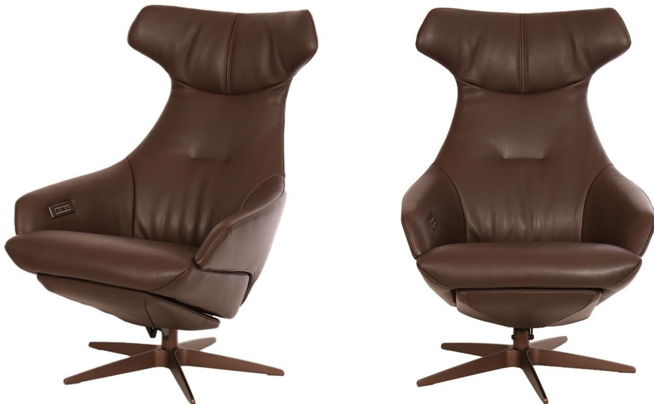
Afgebeeld Model ARC