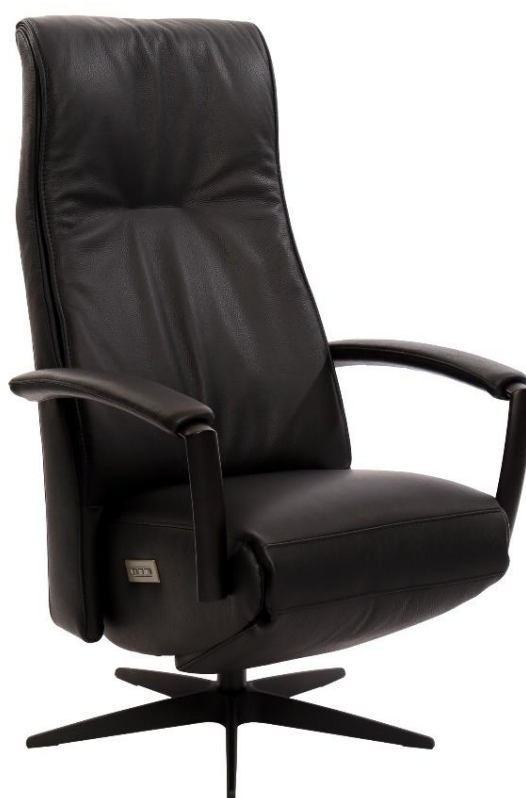
Afgebeeld Model Twinz